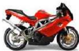
DB4 Full Fairing