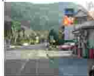
von Koblenz nach Tankstelle rechts Richtung: Mehrzweckhalle Sportanlagen Friedhof