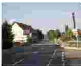
von Basel Richtung Koblenz vor Tankstelle links Richtung: Mehrzweckhalle Sportanlagen Friedhof