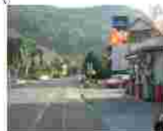
von Koblenz nach Tankstelle rechts Richtung: Mehrzweckhalle Sportanlagen Friedhof