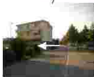
nach ca. 70m links in die Breitensteinstrasse, Haus rechts am Ende der Strasse (ca. 100m)