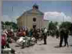
11.000 in Kirchfest