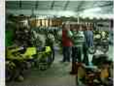
1000 in 1000 in 1000 in 1000