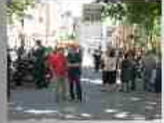
1000 in 1000 in 1000 in 1000