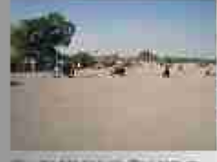
1000 in 1000 in 1000 in 1000