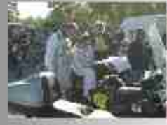
1000 in 1000 in 1000 in 1000