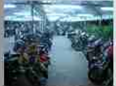
1000 in 1000 in 1000 in 1000