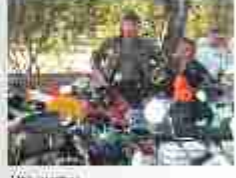
1000 in 1000 in 1000 in 1000