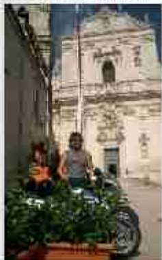
1000 in 1000 in 1000 in 1000