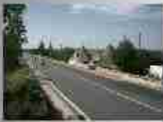
1000 in 1000 in 1000 in 1000