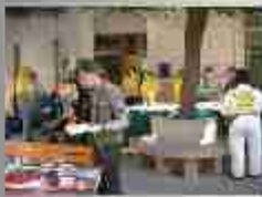
100 auf der besten Terrasse zu Mittagessen