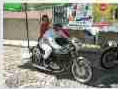
A viele Wäckerl auf die Straße auf der Straße, in der die "Cassero" (Torte) der Pflanz- und Obst- und Torte (Torte)