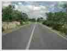
La valle ha una delle Cassero 1000 in 1000 in 1000 in 1000