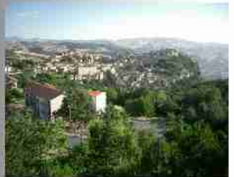
1000 in 1000 in 1000 in 1000