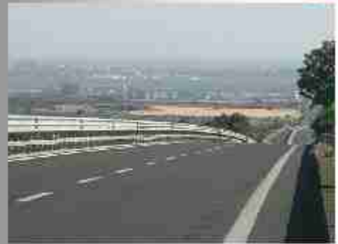
1000 in 1000 in 1000 in 1000