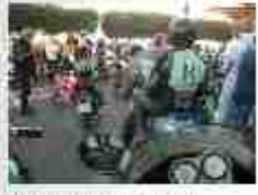
1000 in 1000 in 1000 in 1000