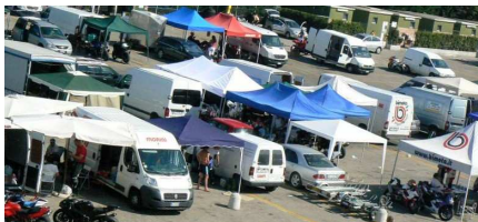
Il paddock di Misano, utenti del forum ed hospitality Bimota per un incontro speciale

Nella seconda giornata, in collaborazione con Braghi Racing, si è organizzata una sessione di prove libere in