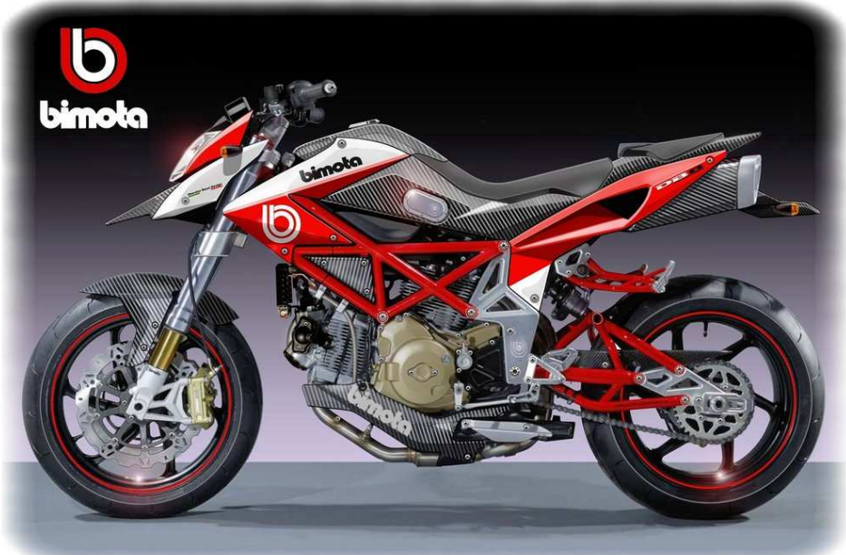
Oberdan Bezzi Design

Bella l'idea, bello anche lo studio di stile, ma assolutamente priva di fondamento la notizia che tale moto possa prendere forma nel prossimo futuro della "maison" riminese, concentrata più che mai sull'ottimizzazione del prodotto DB7 e sul catalogo accessori per moto e merchandise che verrà presentato al prossimo salone di Milano.