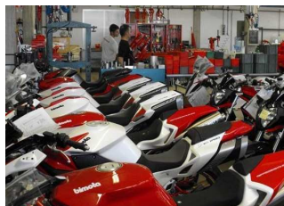
Il reparto produzione Bimota, visitato dai "motobikers"