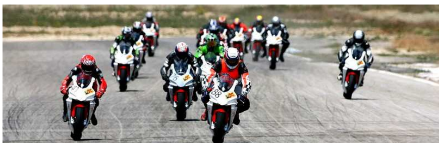
Il gruppo di DB5 presso il circuito di Racalmuto in occasione del primo Bimota Race Club

Ospita anche numerosi eventi in pista come prove prodotto (Bimota T-T Days) e supporta l'attività racing nelle categorie Supertwins e Protwins nel Ducati Desmo Challenge.