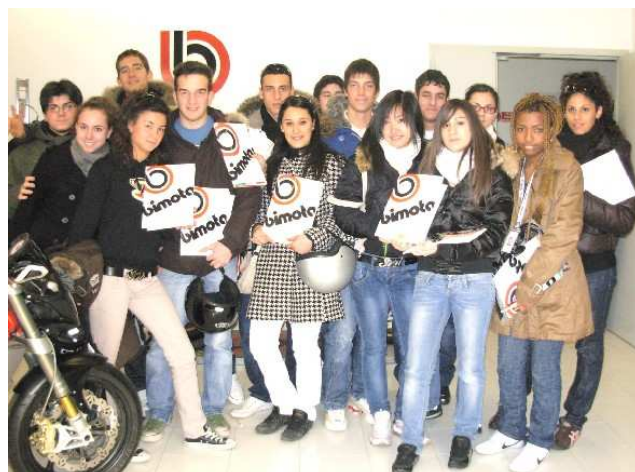
Un gruppo di studenti in visita

Gruppo 1 - ore 09:30 Gruppo 2 - ore 11:30 Gruppo 3 - ore 14:30 Gruppo 4 - ore 16:30