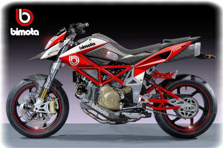
Oberdan Bezzi Design

Bella l'idea, bello anche lo studio di stile, ma assolutamente priva di fondamento la notizia che tale moto possa prendere forma nel prossimo futuro della "maison" riminese, concentrata più che mai sull'ottimizzazione del prodotto DB7 e sul catalogo accessori per moto e merchandise che verrà presentato al prossimo salone di Milano.